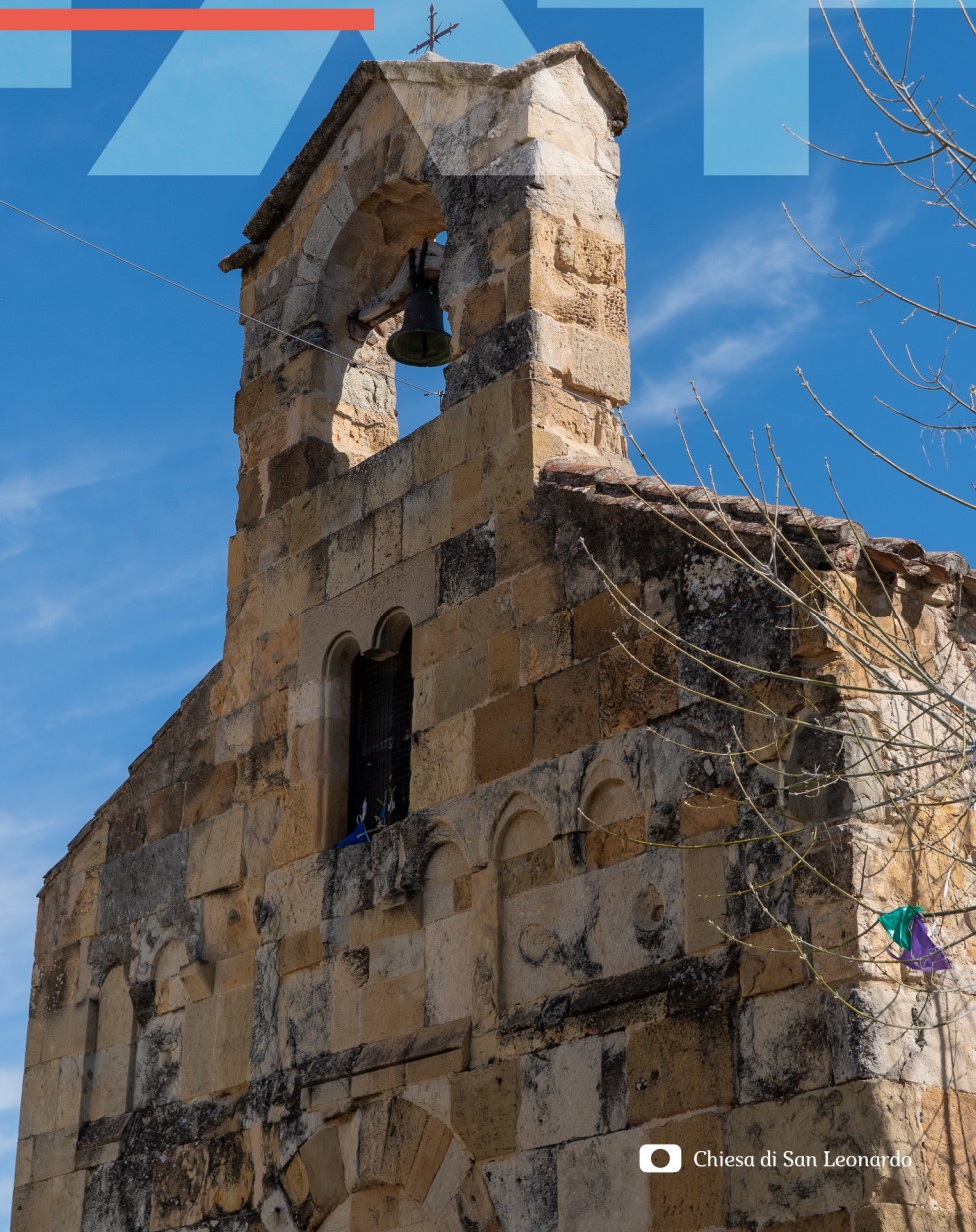
Chiesa di San Leonardo